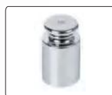
校准砝码 (8310-120MC, 8310-210MC, 8310-320MC标配)